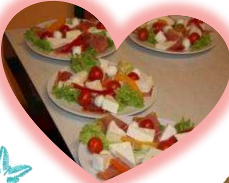
Die Vorspeise steht bereit für das Drei-Gänge-Menü beim „Ausgehabend für Ehepaare“ am 14. Februar. (links)