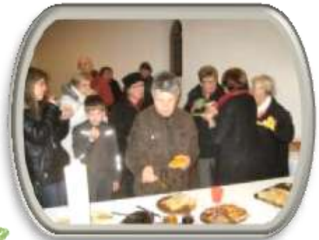
Gemeinsames Essen nach der „Begrüßung des Sonntags“ in Oberschefflenz. (rechts)