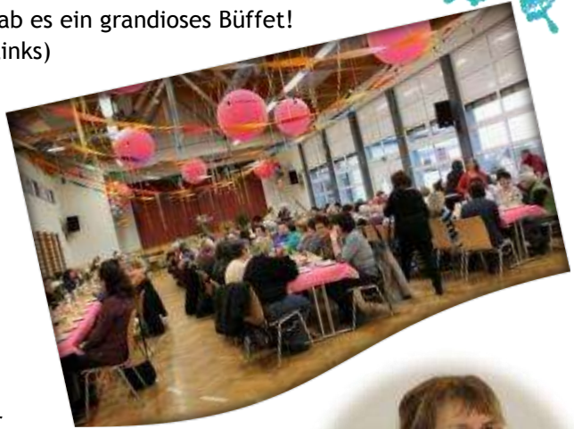
Mit 220 Teilnehmerinnen war die Roedderhalle beim Ökumenischen Frauenfrühstück bis auf den letzten Platz gefüllt. (rechts oben)