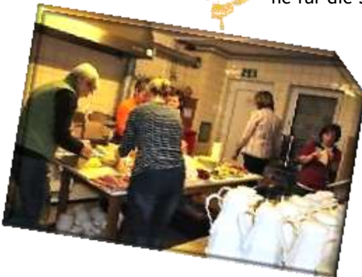
Ohne das fleißige Küchenteam wäre das Ökumenische Frauenfrühstück nicht möglich gewesen. (links)