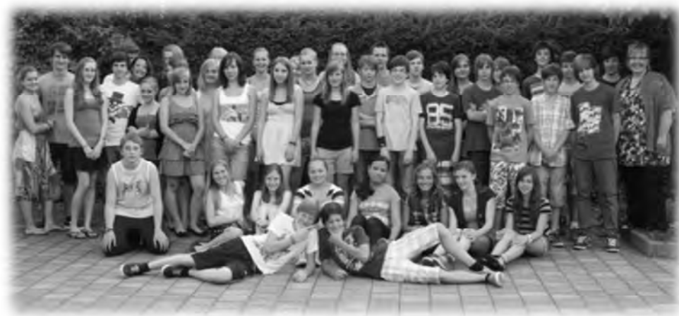
Konfirmanden mit Konfirmanden-Mitarbeiter

Wir alle - Mitarbeiter wie Konfirmanden – freuen uns, auf die vor uns liegenden Monate, in denen wir uns gemeinsam auf den Weg machen, Gott besser kennenzulernen.