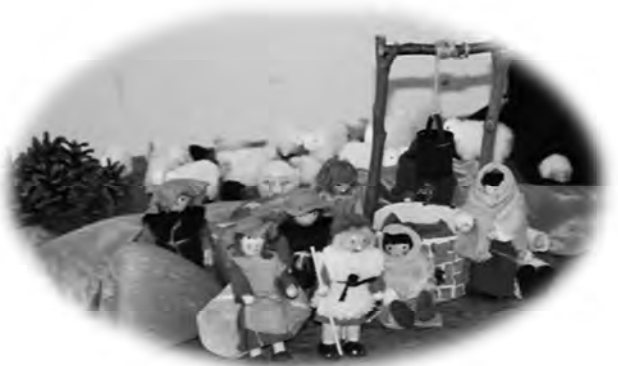
Eine Impression vom Kindertag.