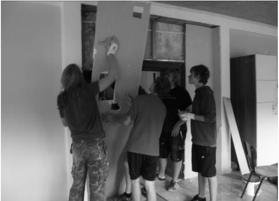
Jugendliche von H. O. T. im Arbeitseinsatz in Rumänien.

Jeden ersten Samstag im Monat von 9:00 Uhr - 12:00 Uhr (außer in den Schulferien) haben sie die Möglichkeit im ehemaligen Grundbuchamt in Oberschefflenz Kleider abzugeben. Die nächste Kleiderannahme findet am 03. Dezember statt.