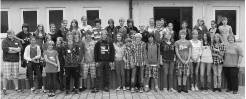
Konfis und Mitarbeiter

22 Jungen und Mädchen wurden zum Konfirmandenunterricht 2011/2012 angemeldet, und zwar aus