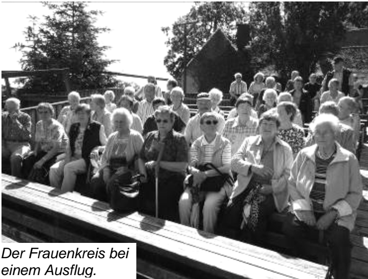
Der Frauenkreis bei einem Ausflug.

In der momentanen Vakanzzeit haben wir das Problem, wie kommen wir an geeignete Referenten, dass die kommenden Monate mit einem Programm ausgefüllt werden.