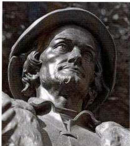
Skulptur des Reformators Philipp Melancthon am weltgrößten Lutherdenkmal in Worms.

Im Sommer 1518 kam ein 21-jähriges Wunderkind an die Universität Wittenberg, ein gewisser Philipp Melancthon, der schon mit zwölf in Heidelberg studiert und mit siebzehn seinen Magister gemacht hatte. Bis zu 600 Hörer strömten in seine Griechisch-Vorlesungen. Der messerscharfe Denker begann eine fruchtbare Zusammenarbeit mit dem 14 Jahre älteren Martin Luther, Professor für biblische Theologie: „Ich habe von ihm gelernt, was das Evangelium ist“, sagte Melancthon über Luther, und der revançierte sich mit dem Bekenntnis, Philippus sei ihm „sehr lieb“, denn „wo ich zu hitzig wurde, hat er mir immer den Zügel gehalten und Frieden und Freundschaft nicht sinken gelassen“. Philipp Melancthon (1497–1560) verband Luthers Visionen mit humanistischer Gelehrsamkeit und brachte so die