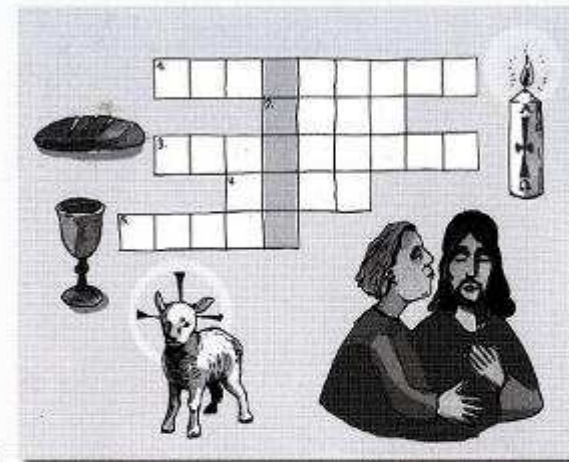
Lösungswort 1: NEUES

Jesus feierte mit seinen Jüngern das..... (1). Dazu ritt er auf einem..... (2) in die Stadt..... (3) ein. Als Jesus sich mit seinen Jüngern zum Mahl gesetzt hatte, nahm er das Brot, dankte, brach es und sprach: „Das ist mein .... (4)“. Dann nahm er den Wein, dankte Gott und sprach: „Das ist mein Blut.“ Danach ging Jesus mit den Jüngern in den Garten Gethsemane. Dort kam eine Gruppe Soldaten zu ihnen, unter ihnen war auch... (5), der ihn verraten hatte.